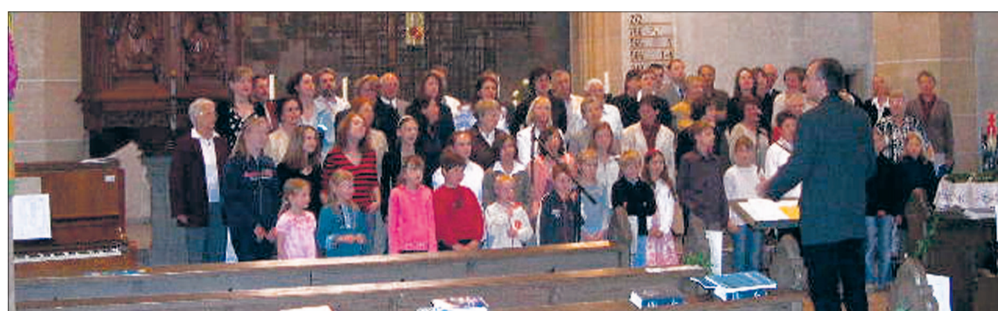
Jung und Alt vereint beim Chorauftritt in der Vaihinger Stadtkirche.